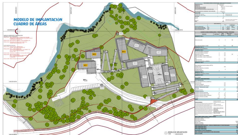
Plano del Modelo de Ocupación propuesto – Cuadro de necesidades

Para el periodo de 2021, se ejecuta el contrato de elaboración del compendio de documentación técnica, para complemento de la propuesta del Modelo de ocupación, con el objetivo de asegurar la construcción de la totalidad de insumos requeridos para la aprobación de la Licencia Urbanística, como requisito principal, previa radicación del proyecto de construcción.